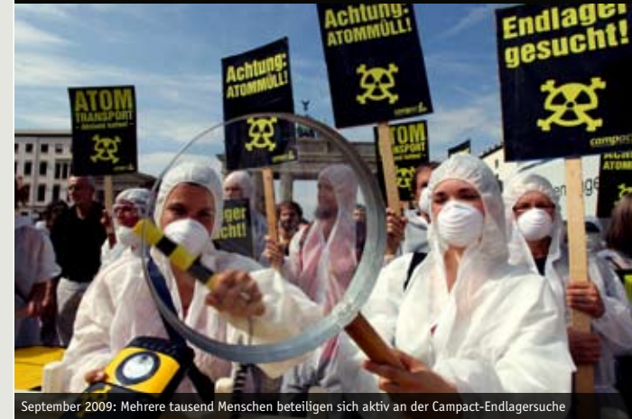
September 2009: Mehrere tausend Menschen beteiligen sich aktiv an der Campact-Endlagersuche