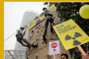
September 2009: Abseilen, bevor die Katastrophe kommt!

Großplakaten von den Kommunalvertreter/innen im RWE-Aufsichtsrat den Verzicht auf das Risikoprojekt. Vor der RWE-Zentrale, der Aktionärsversammlung und den Rathäusern der an RWE beteiligten Kommunen zeigen wir mit dem Wackel-AKW, welche Folgen drohen. Im Herbst zieht RWE die Reißleine – damit ist eines der riskantesten AKWs in Europa erstmal gestoppt!