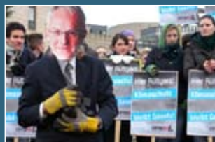
Dezember 2009: BUND NRW und Campact brandmarken Rüttgers öffentlich.

Parallel zum Weltklimagipfel will Jürgen Rüttgers ein NRW-Klimaschutzgesetz kippen. Damit soll E.on doch noch ein Kraftwerk in Datteln fertig stellen können. Der Bau war zuvor gerichtlich gestoppt worden. Mehr als 60.000 Campact-Aktive protestieren innerhalb weniger Tage. Doch Rüttgers bleibt stur.