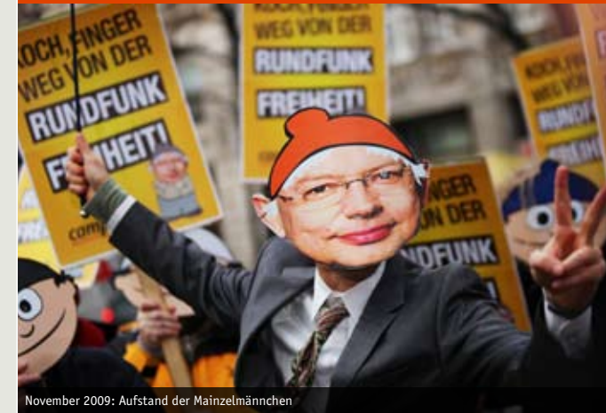
November 2009: Aufstand der Mainzelmännchen