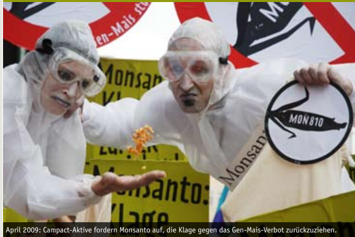
April 2009: Campact-Aktive fordern Monsanto auf, die Klage gegen das Gen-Mais-Verbot zurückzuziehen.