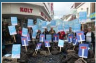
Mai 2009: Kohle-Sackgasse gegen neuen Klimakiller in Krefeld