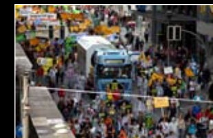
September 2009: Nicht die Atomkraft sondern der Widerstand dagegen ist stark wie nie