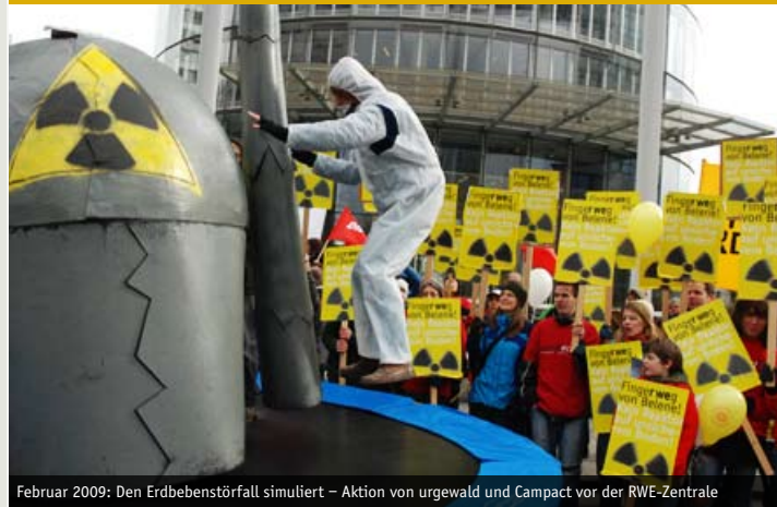
Februar 2009: Den Erdbebenstörfall simuliert – Aktion von urgewald und Campact vor der RWE-Zentrale