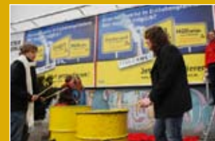
April 2009: Ärgerte die Oberbürgermeister – Großplakate in ihren Städten