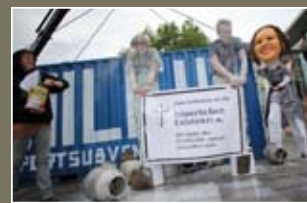
Juni 2009: Aktion beim Außenwirtschaftstag in Berlin

Druck: Recyclingflyer.de auf Resa-Offset-Recyclingpapier