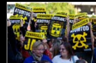
September 2009: Flashmobs transportieren das Atomthema in den Wahlkampf

und mobilisieren Tausende zur Großdemo nach Berlin. Unsere Aktionstour durch zwölf Großstädte bringt das Thema der Endlagerproblematik in die Regionen, in hunderte Medien – und Abgeordnete ins Schwitzen. Flashmobs tragen die Atomrisiken in den CDU- und FDP-Wahlkampf. Noch in der Wahlnacht starten wir einen Offenen Brief: Über 100.000 Menschen kündigen ihren Protest gegen einen Ausstieg aus dem Ausstieg an. Wir legen mit einer Telefondemonstration nach. Der Koalitionsvertrag bleibt in punkto Atom erstaunlich vage. Unser Widerstand geht weiter!