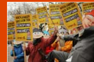
November 2009: Aktion vor der entscheidenden Sitzung des ZDF-Verwaltungsrats in Berlin.

Petition dagegen. Dennoch wird Brender seinen Job los, weil unbequeme und überparteiliche Journalisten wie er den schwarz-roten Proporz in den Sendern unterlaufen. Doch anstatt wie die SPD auf kleine Korrekturen etwa im Verwaltungsrat zu setzen, will Campact das ZDF grundlegender reformieren: Tausende Campact-Aktive werben bei ihren Wahlkreisabgeordneten für die Unterstützung einer Verfassungsklage – mit guten Chancen. Die Kampagne läuft weiter!