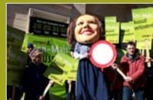
März 2009: Eine Countdown-Uhr mahnt das Gen-Mais Verbot an

hatten wir für einen Proteststurm gesorgt und mehr als 50.000 Menschen unterzeichneten unseren Appell an Aigner. Wo die Ministerin öffentlich auftritt, ist sie mit hunderten aufgebracht Bürger/innen aus der Region konfrontiert. Eine rückwärts laufende Uhr zeigt ihr, wie viel Zeit ihr noch bis zur Aussaat bleibt. Mit einem Gutachten belegen wir, dass ein Verbot auf aktuellen Risikostudien basieren kann. Trotz des Erfolgs: Mit der neuen Regierung droht ein Kurswechsel – die Kampagne geht weiter!